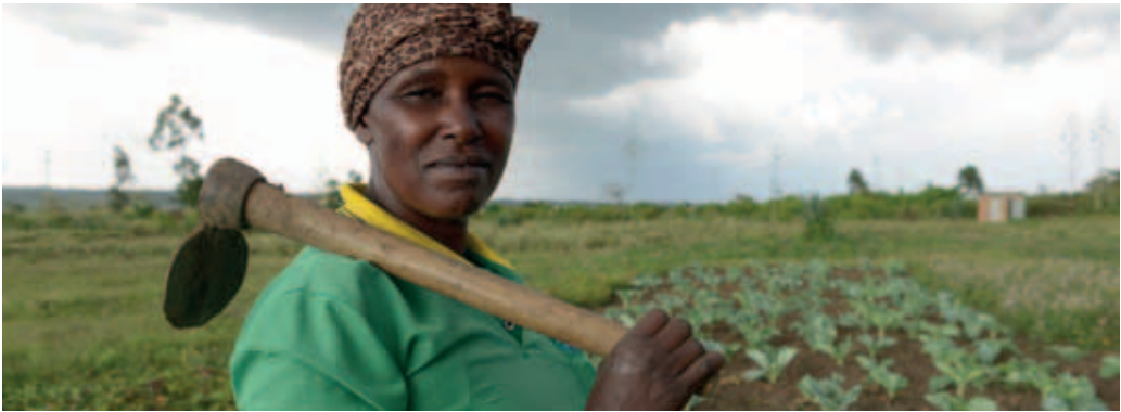
v.l.: Foto zur 66. Aktion von Brot für die Welt