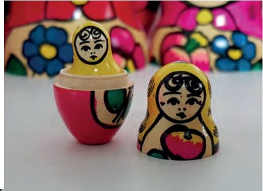
v.l.: Macht los!; Matroschka-Puppe ... fremd in zwei Welten