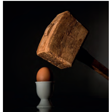
v.l.: wehrhafte Demokratie liefert Waffen?; Machtlos?