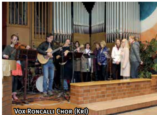
Vox RONCALLI CHOR (KRI)

Der erste ökumenische Gottesdienst im Roncalli-Zentrum in Glattbach hatte das Thema: