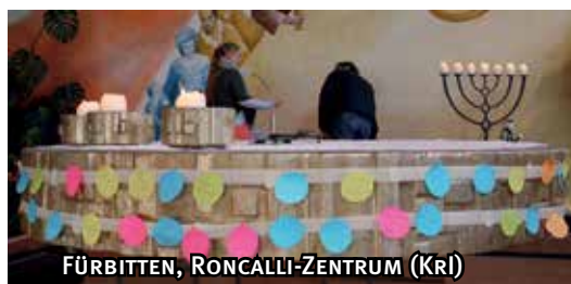
FÜRBITTEN, RONCALLI-ZENTRUM (KRI)

Ostermontag, am 2. April um 17 Uhr, Emmausgang für Groß und Klein von Johannesberg zur Breunsberger Kapelle.