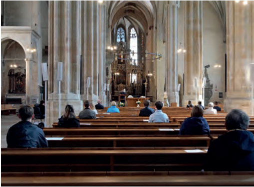
Abstand halten - auch in der Kirche!