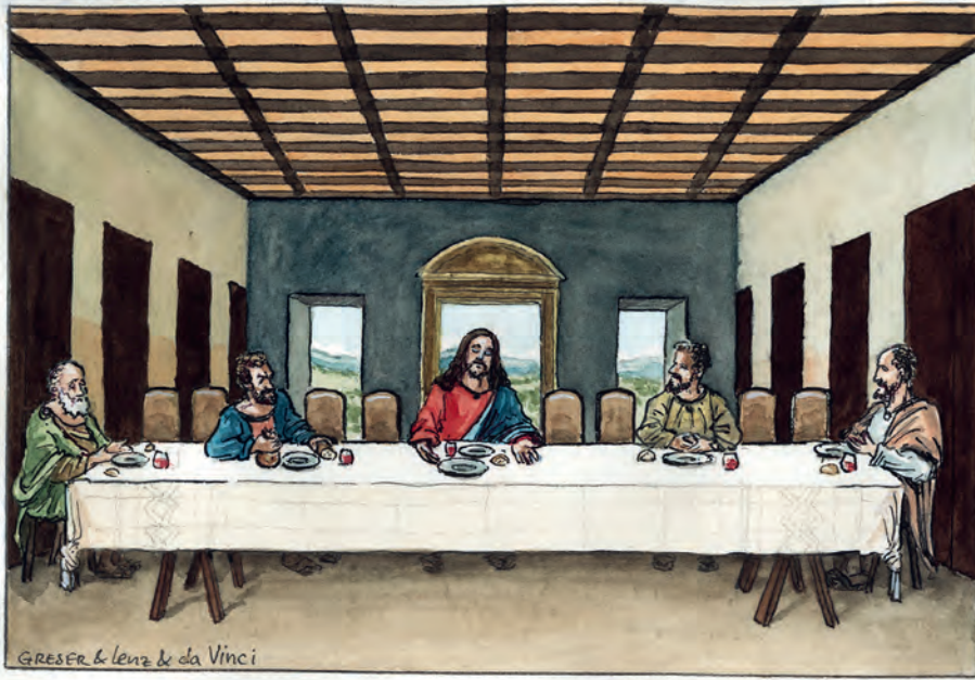
Bild (auch Titel): Greser&Lenz, „Corona, letztes Abendmahl, da Vinci“ mit freundlicher Genehmigung