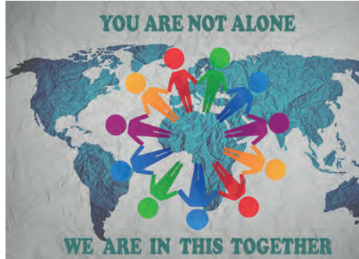
Eine solidarische Welt?