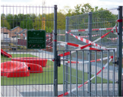
Spielplatz und KiTa geschlossen