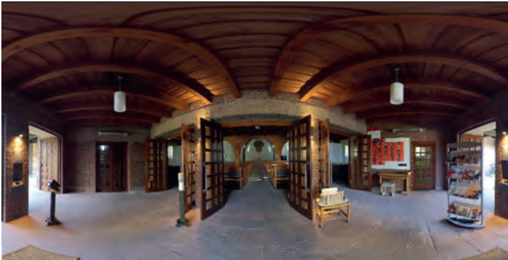
Der Eingang zur Pauluskirche, aufgenommen mit der 3D-Kamera.