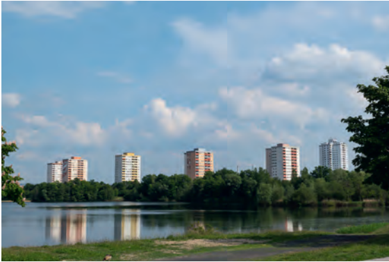
Mainaschaff – Skyline