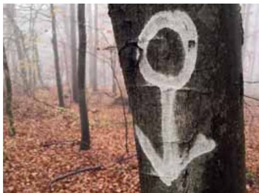
Sexuelle Identität? Symbol für „Transfrau“ auf dem Baum rechts