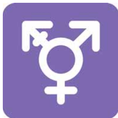
Bilderv.l.: Saset13 auf pixabay; Transgender-Symbol von creazilla