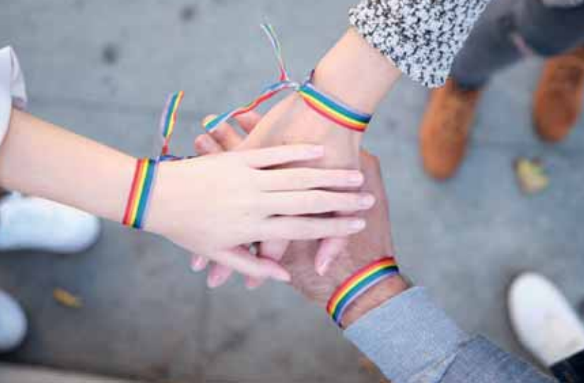
Hände einer Gruppe von drei Personen mit LGBT-Flagge-Armbändern