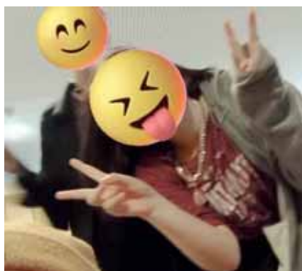
Offener Sommer im JuZ, Schnappschuss.