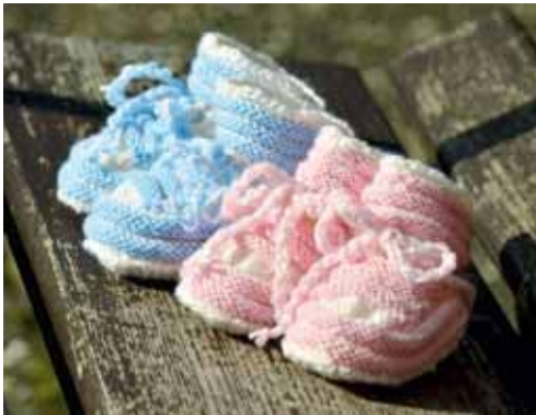
v.l.: Festlegungen: Mädchen in rosa, Jungs in blau?;