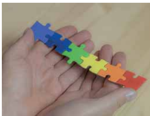
Beispielbilder zu „Alles Regenbogen“